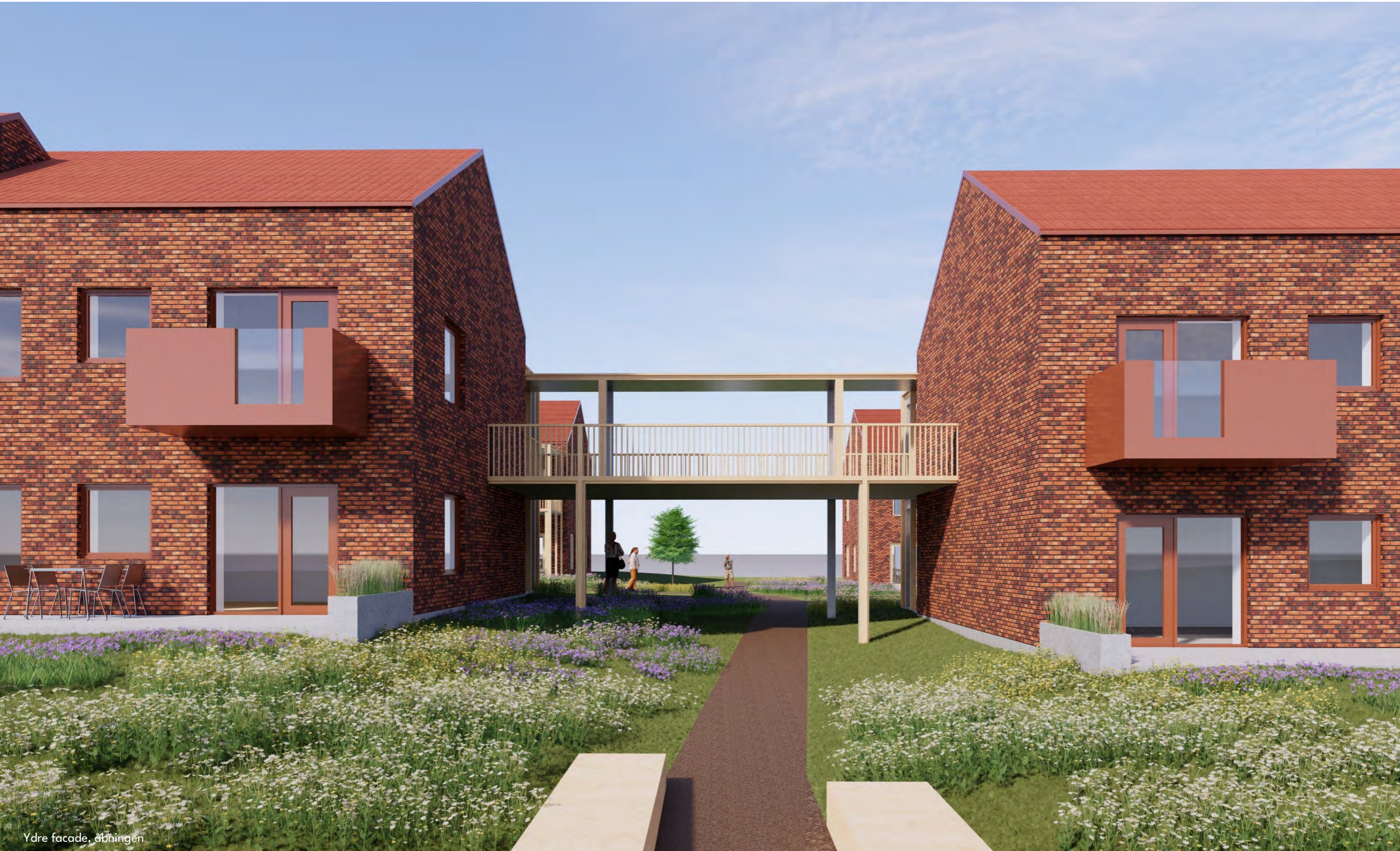
Ydre facade, åbningen