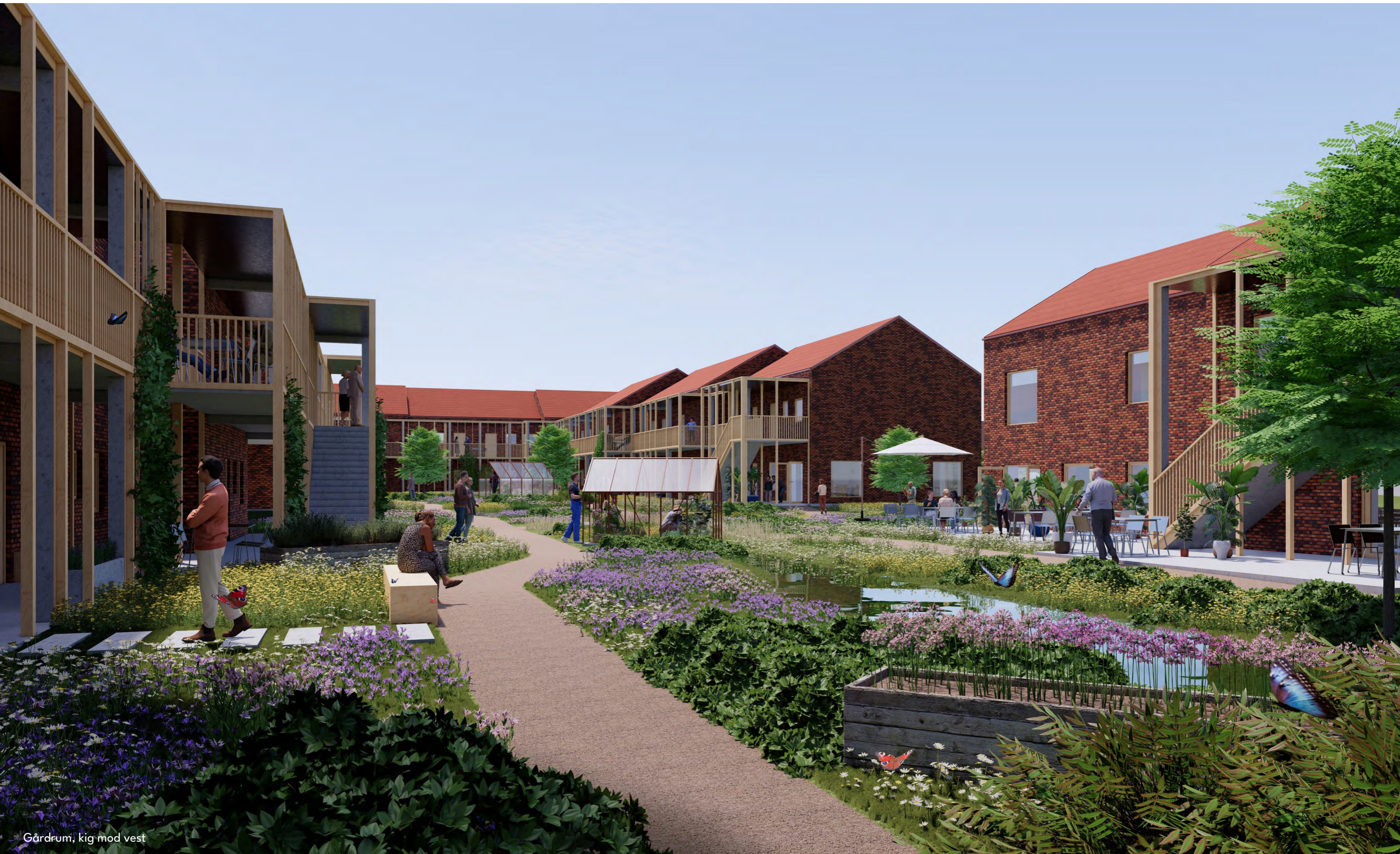
Gårdrum, kig mod vest