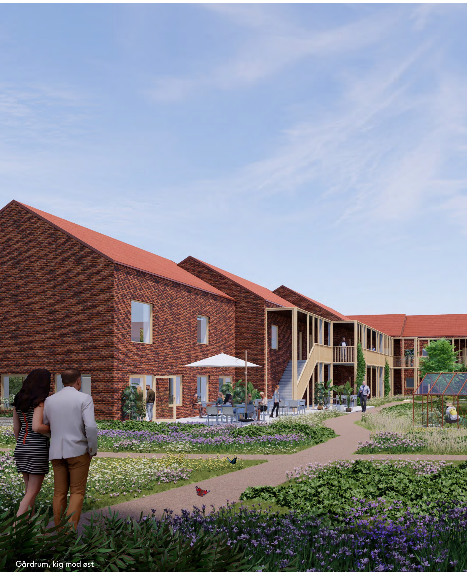
Gårdrum, kig mod øst